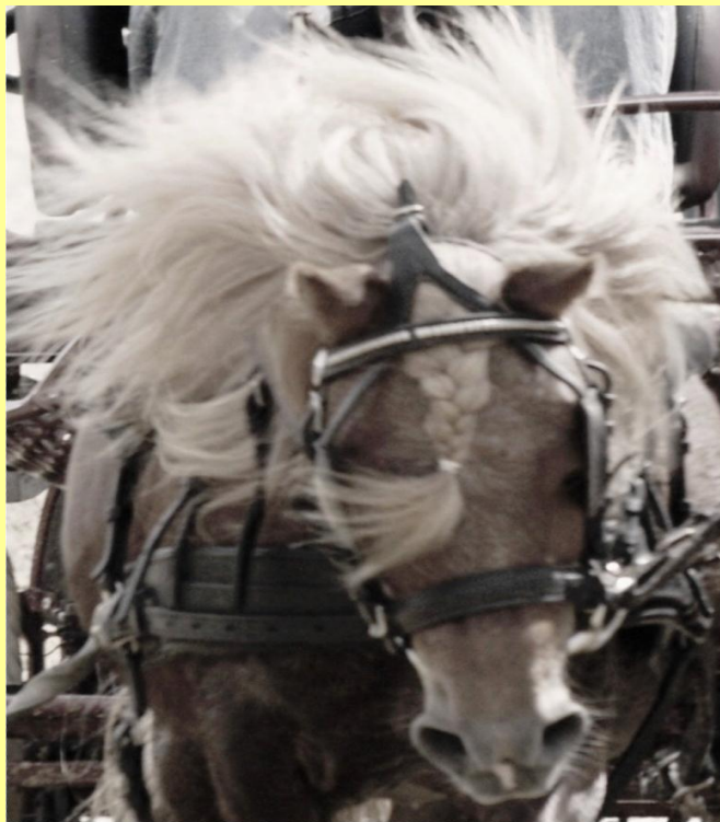
Kampioen 2011 ?? (wacht maar tot ik groot ben....)