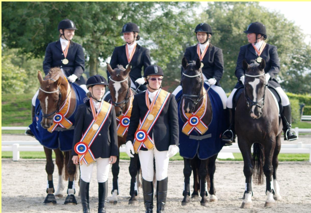
Foto: Viertal, Nederlands Kampioen 2010

Adres : KNHS, De Beek 125, 3852 PL Ermelo Telefoon : 0577-408220 Fax : 0577-401725 Internet : www.knhs.nl